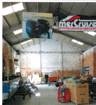
Edificio 2: copertura costituita da lastre in cemento amianto