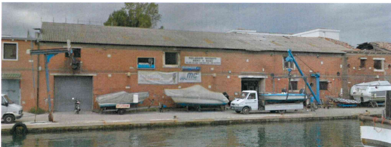
Edificio 1: copertura in lastre di cemento amianto

Vista planimetrica con identificazione del lotto oggetto di intervento. Sono evidenziati gli edifici su cui intraprendere le principali azioni di ispezione ed eventuale successiva caratterizzazione. Non sono presenti scoperti pertinenziali.